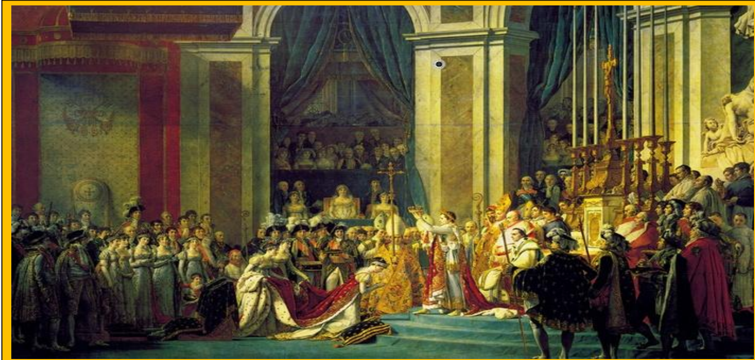
Koronacja cesarska Napoleona I Bonaparte